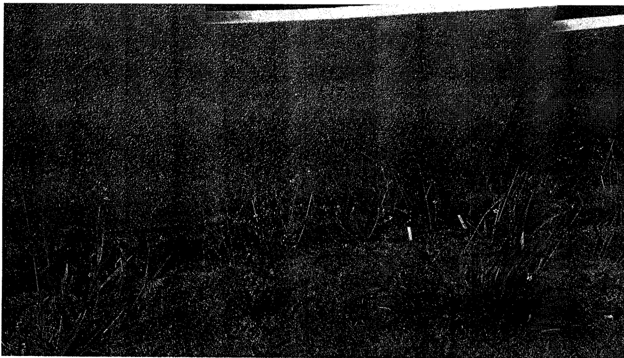
INSTALAÇÃO DE ALAMBRADO