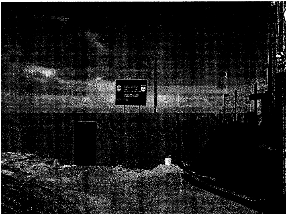
Observatório/Mirante, lacrado pelo exército.