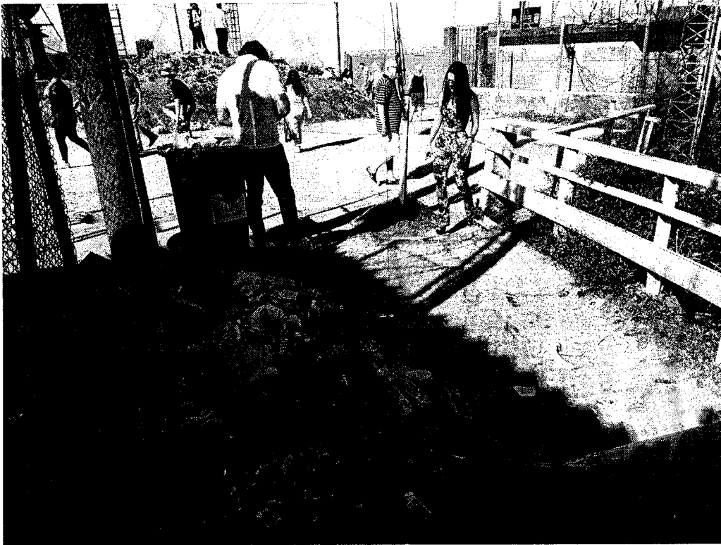
Pico do Itapeva – não há nenhuma estrutura no local. Lixos sendo dispensados no chão.