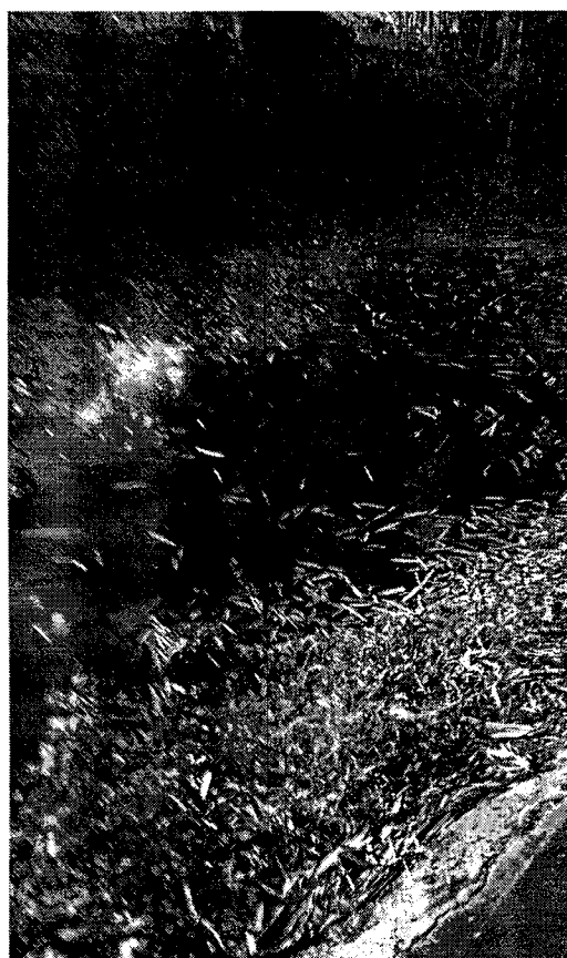
Água parada atraem insetos e animais peçonhentos