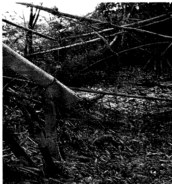
Acumulo de mato e lixos