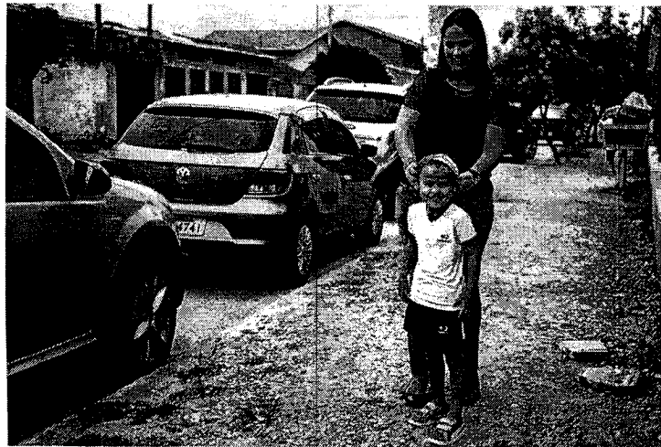
Creche não possui calçada