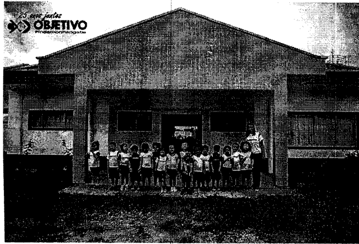
Interior da creche tomado por mato