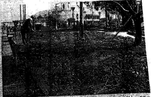
Funcionário da Prefeitura de Pinda durante recuperação da praça São Benedito, no bairro Galvão