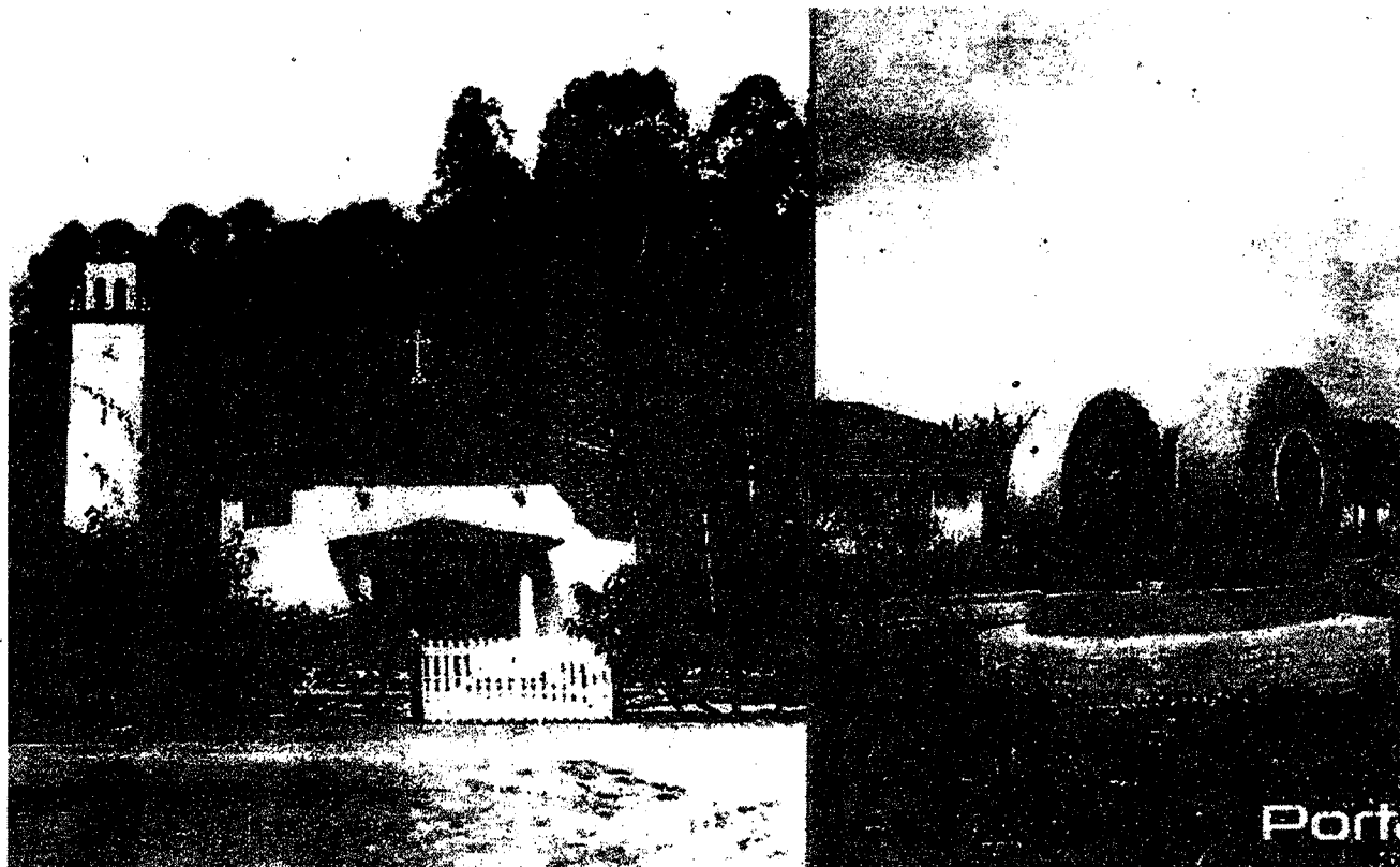
A igreja e a moenda estão entre as benfeitorias que podem ser tombadas.

Em reunião realizada no dia 3 de maio, nas dependências do Museu Histórico e Pedagógico Dom Pedro Leopoldina, o Conselho Municipal de Patrimônio Histórico, Cultural, Ambiental e Arquitetônico de Pindamonhangaba, aprovou o relatório final apresentado por comissão interna que avaliou a solicitação de tombamento a nível municipal de prédios de interesse histórico para a cidade localizados na região da Nobrecel S/A, antiga fazenda Coruputuba, região do distrito de Moreira César.