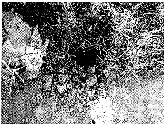
Foto 2- Cano de água exposto, com entulho sendo jogado para tapar esse buraco. Precisa fazer a contenção do terreno antes que o mesmo se rompa.