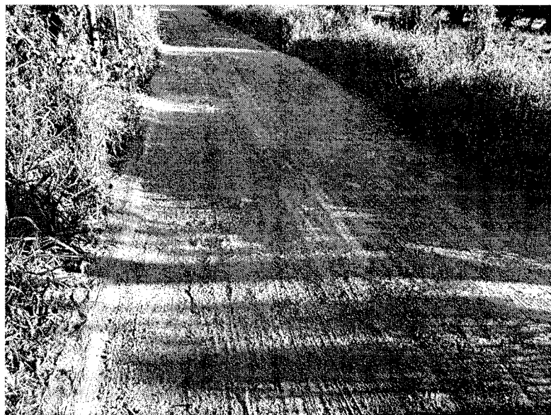
Foto 1 – Ao longo da estrada tem diversos buracos – moradores pedem colocação de terra com cascalho para tapá-los