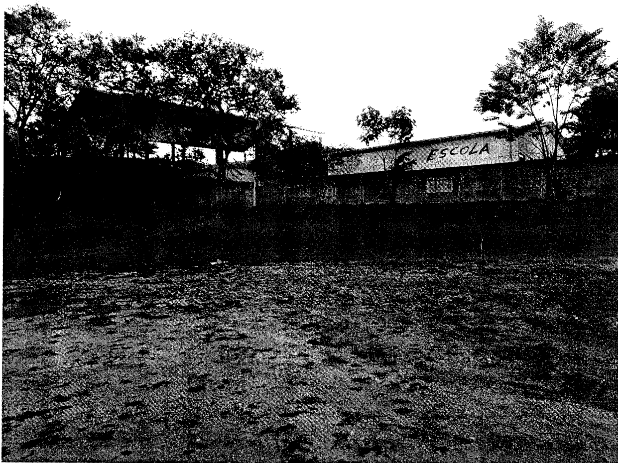
Fundos da escola