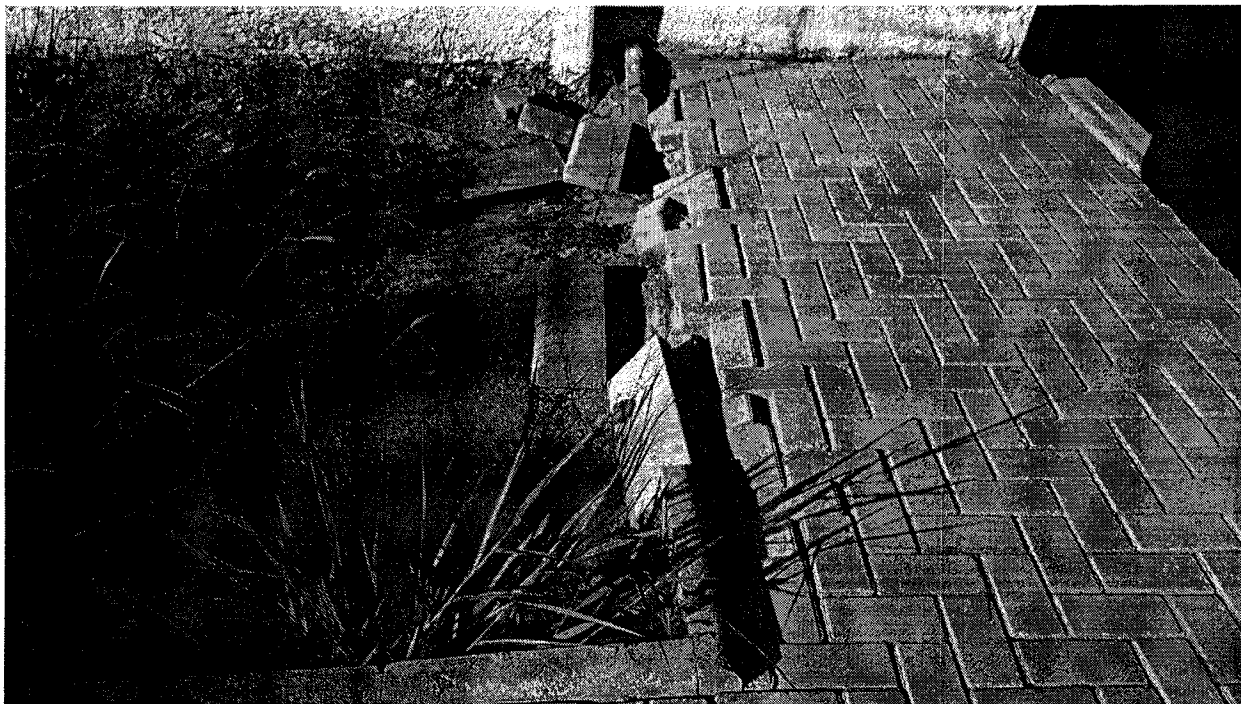
Calçada – bloquetes estão se deslocando – visita dia 31/03/2017