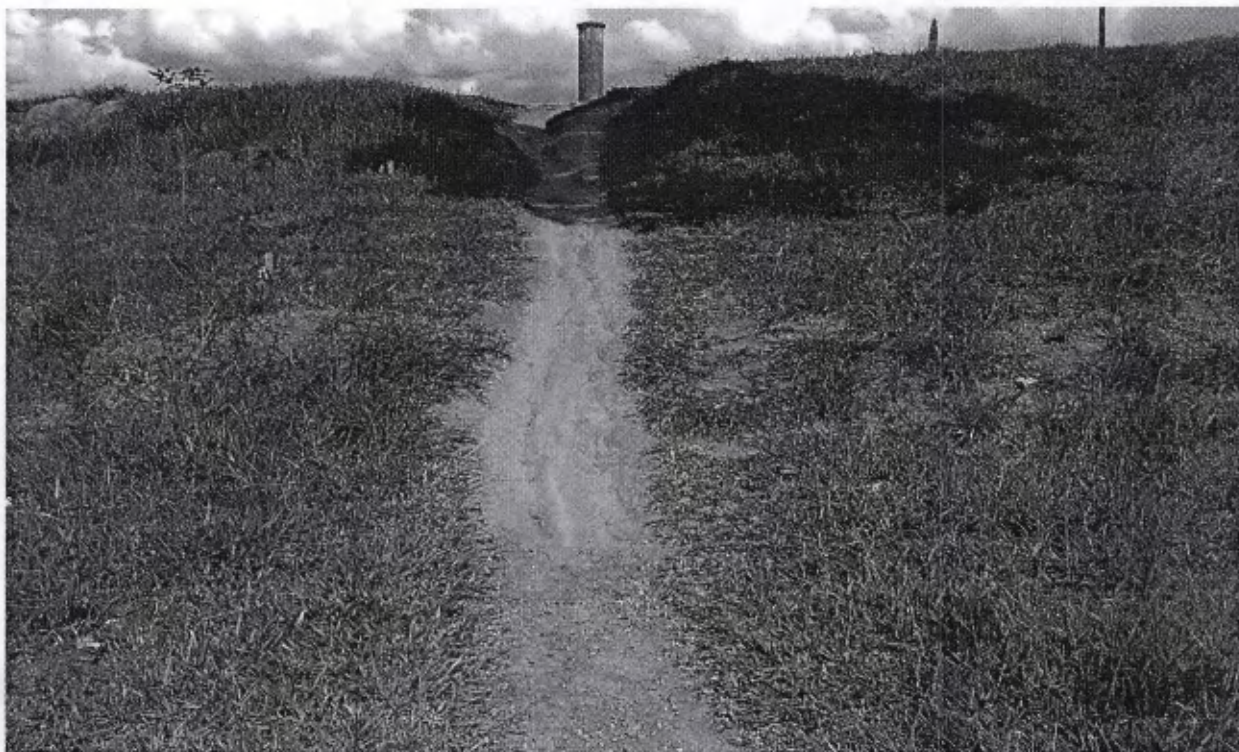
Foto tirada no bairro Morumbi, local onde os transeuntes, moradores do bairro Morumbi e Parque das Palmeiras, utilizam diariamente para acesso ao bairro Morumbi.