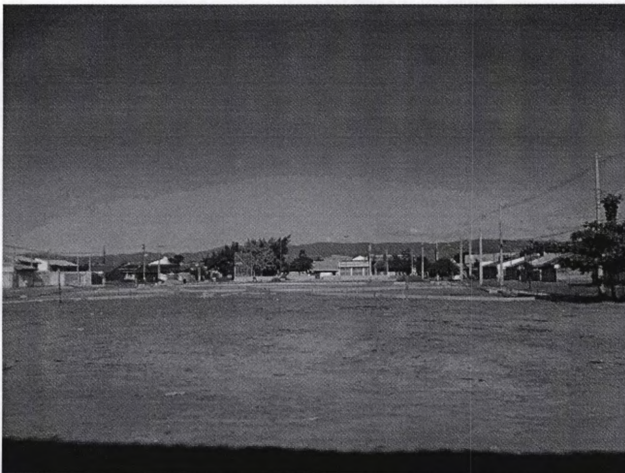
Local onde esta sendo construída a Praça do Pasin, ao lado da Igreja