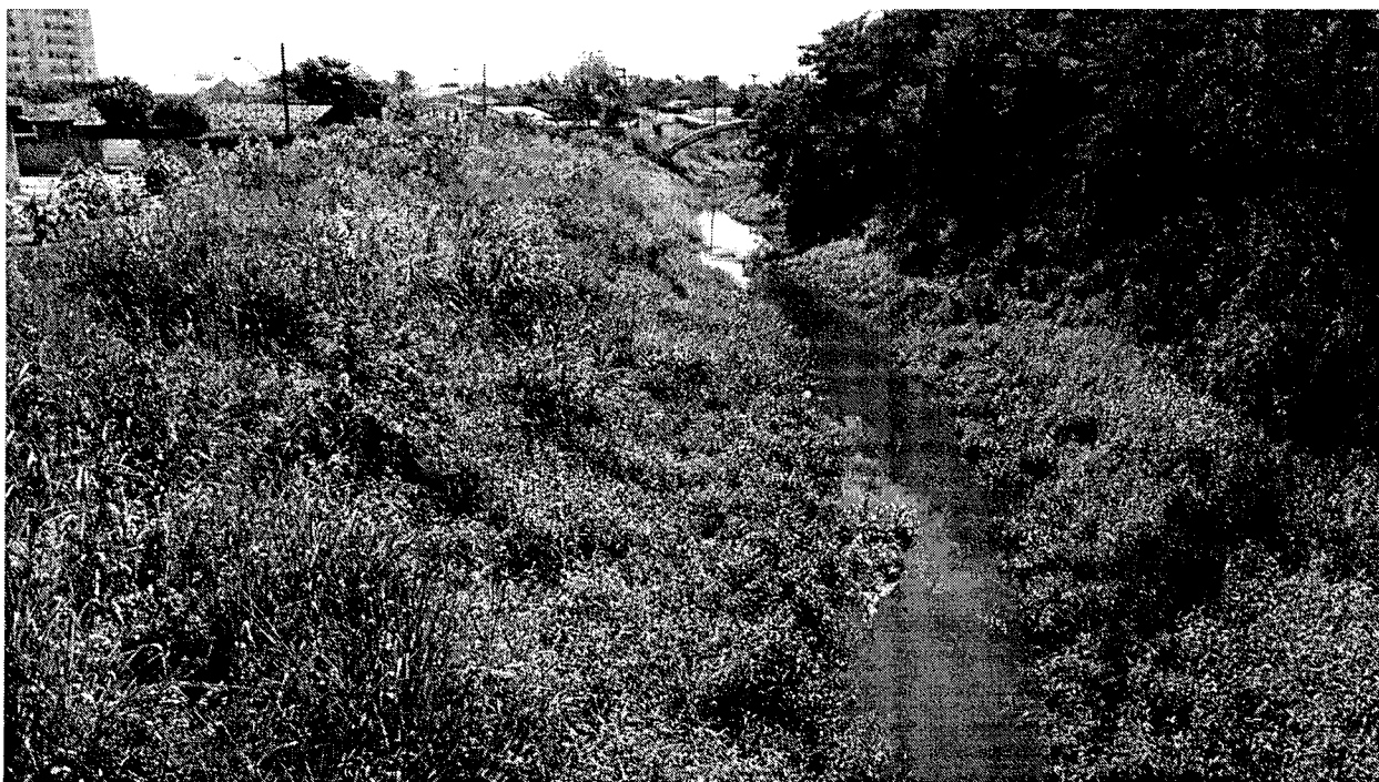
Ribeirão do Curtume – Residencial Andrade – em 15 de maio de 2017