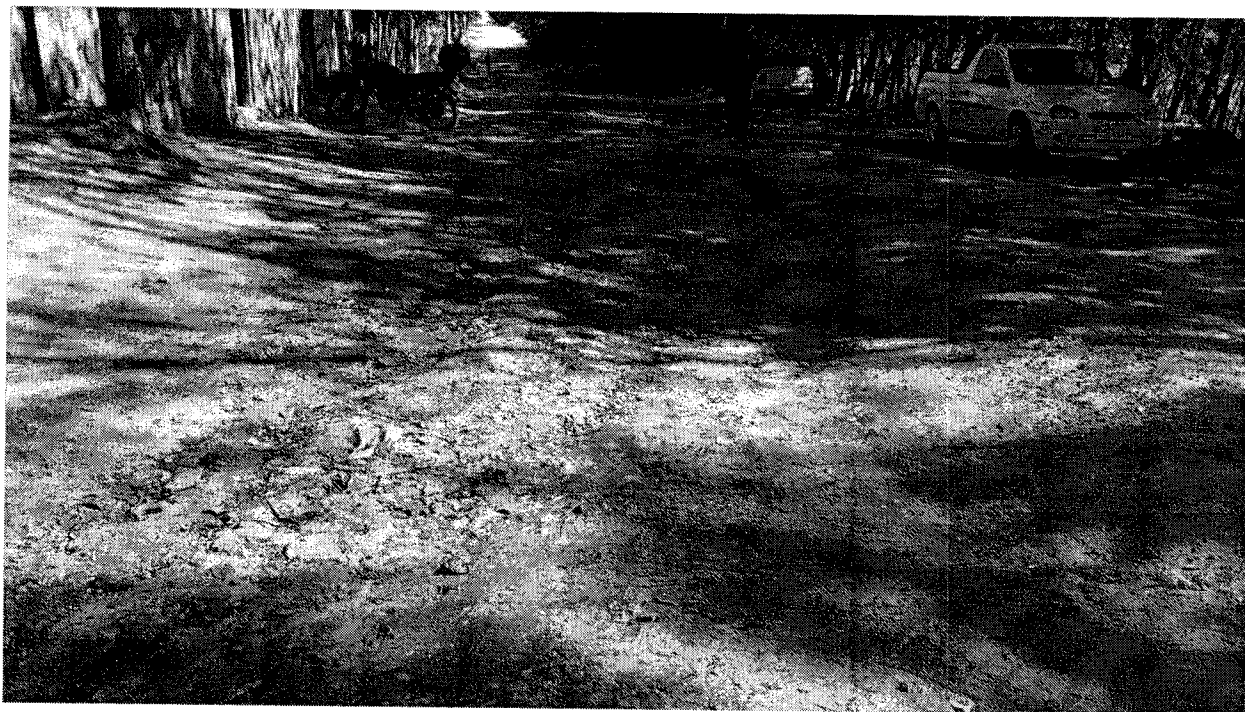
Rua Natália Soares dos Santos, antiga Rua 2 – Bairro Shangrilá