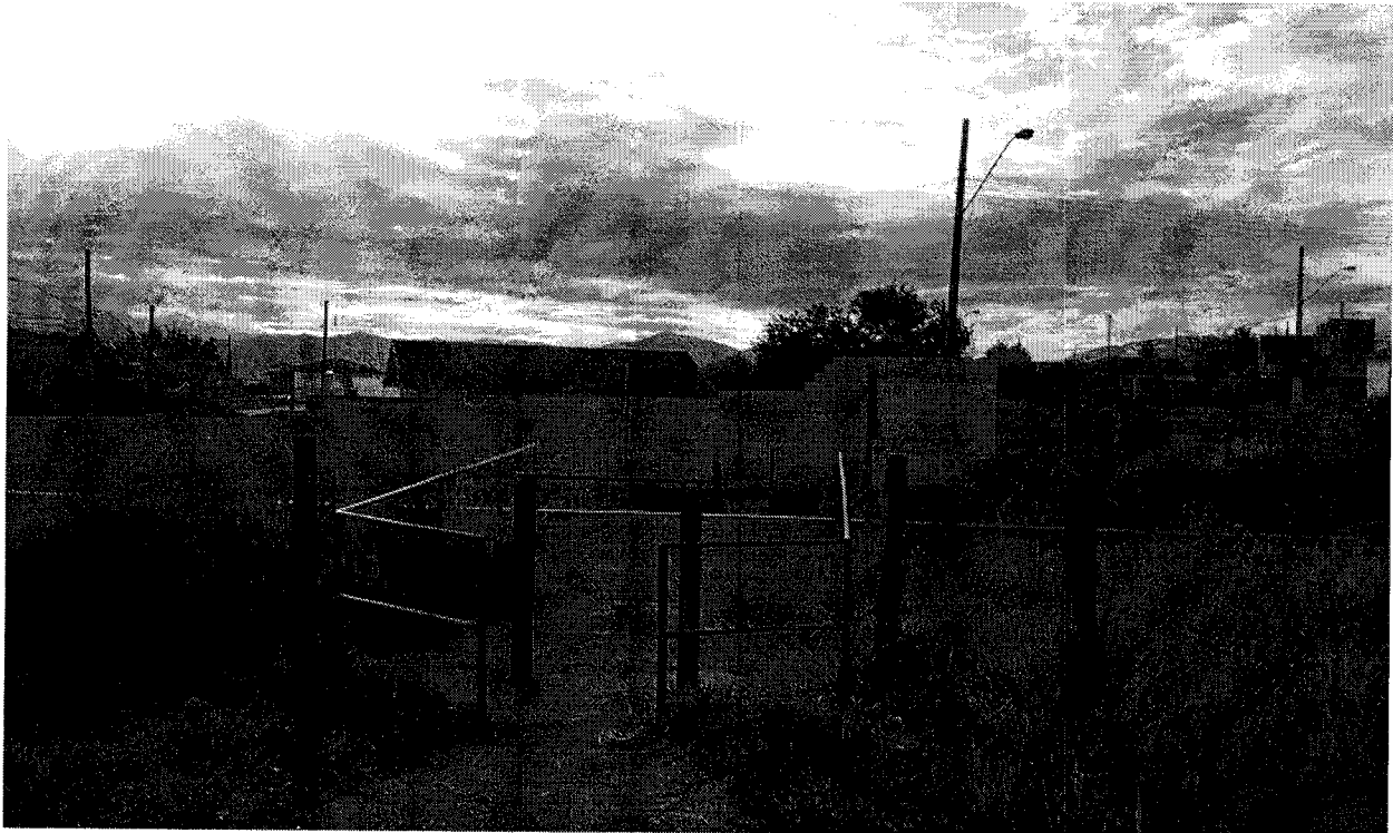
SP062 -Estrada que liga Pindamonhangaba x Taubaté. Pindamonhangaba/SP – Bairro Araretama

- Local sugerido pelos munícipes para construção da passarela sobre a linha férrea