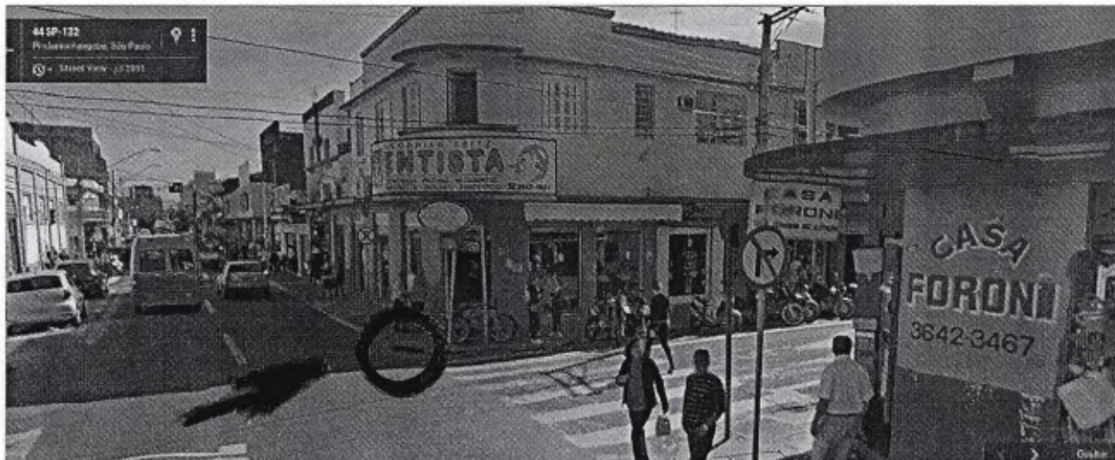
Rua Dr. Gustavo de Godoy esquina com Rua José Martiniano Ferreira Ferraz - Centro