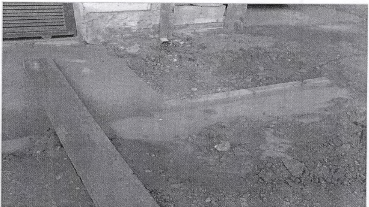
Lamaçal de frente as casas, causam transtornos aos moradores