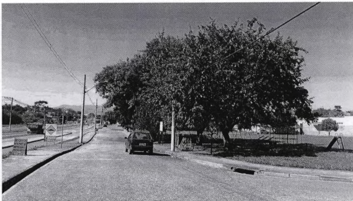
Área Verde – Residencial Triângulo Galhos das árvores estão entrelaçados na fiação - 17/06/2016