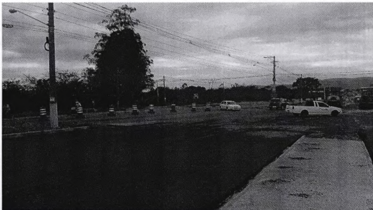
Veículos fazem retorno no local sugerido para construção da Rotatória ou retorno