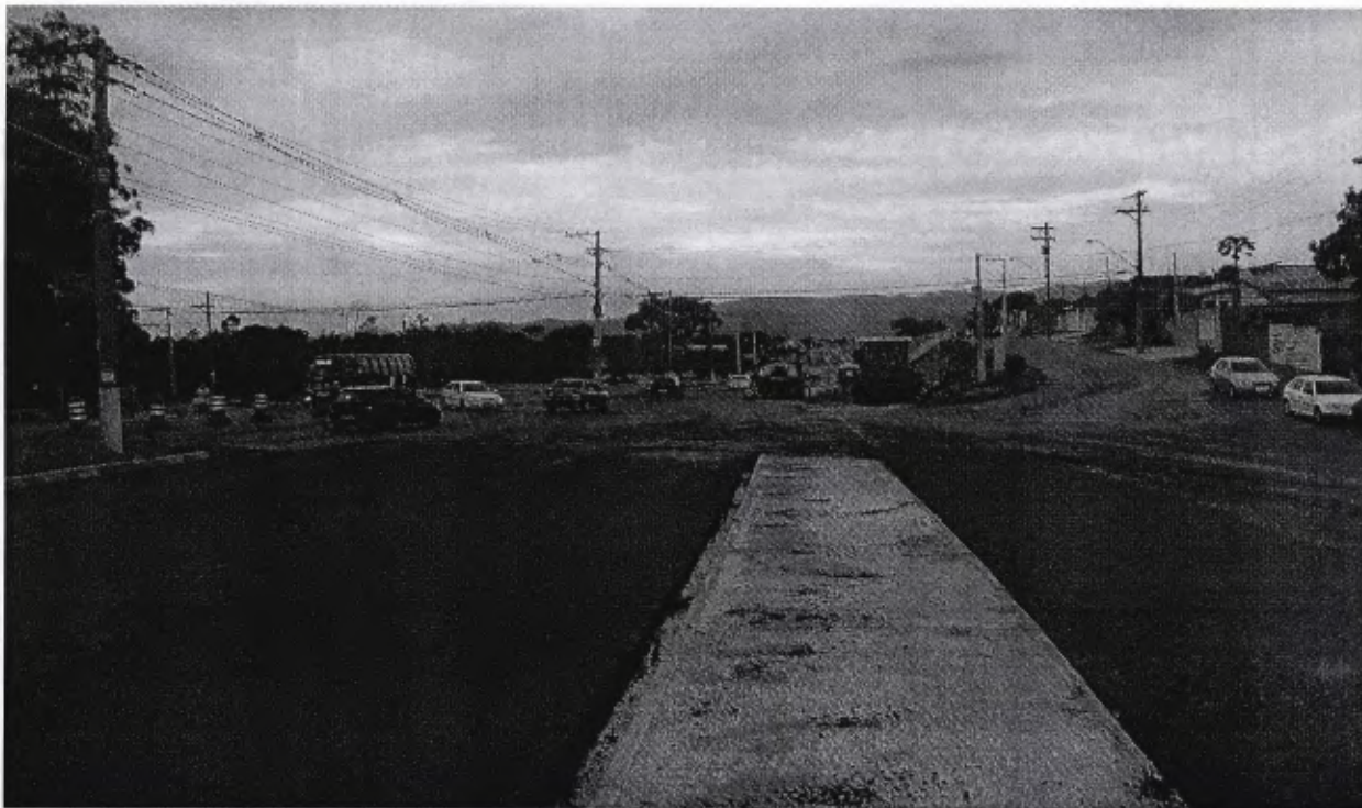
Foto defronte ao Residencial Triângulo, local sugerido pelos moradores e comerciantes para construção de uma rotatória ou de um retorno – Detalhe: veículo fazendo retorno

Com a construção do canteiro central, o bairro ficou sem acesso para quem trafega no sentido do bairro Cidade Nova para o Centro.