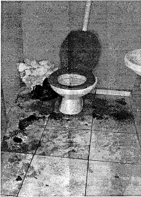
Banheiro todo sujo