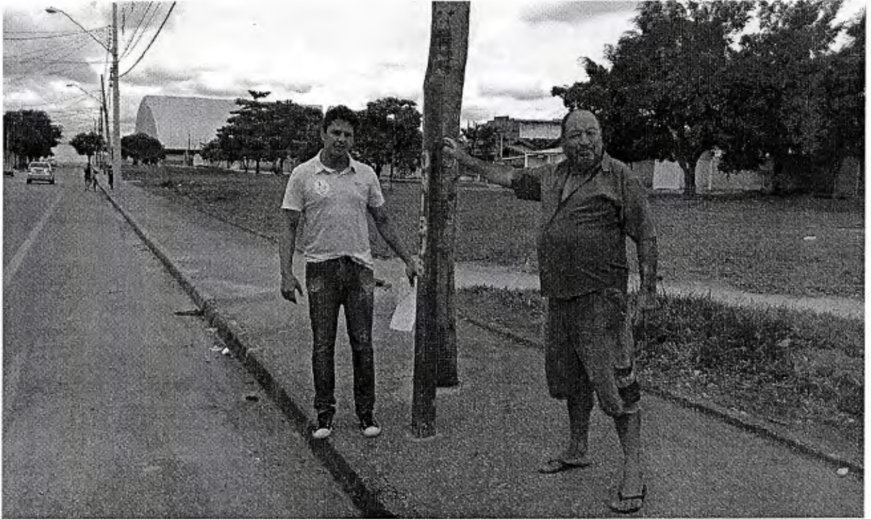
Rua Benedito Pires César, defronte a área verde – bairro Araretama Ponto de parada de ônibus sem abrigo de passageiros