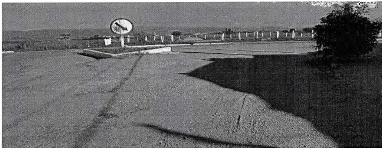
TRECHO SEM ASFALTO