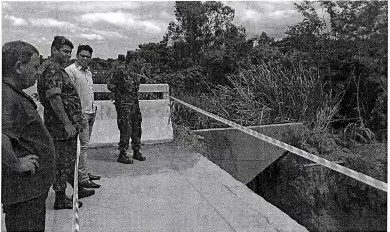
Cabeceira da ponte desabou no dia 26 de Março de 2015