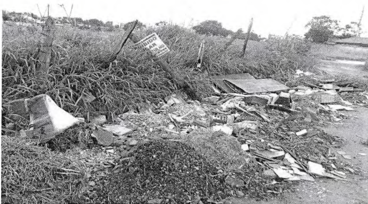
LIXO DESCARTADO DE FORMA IRREGULAR PRÓXIMO A ÁREA VERDE DO JARDIM IMPERIAL