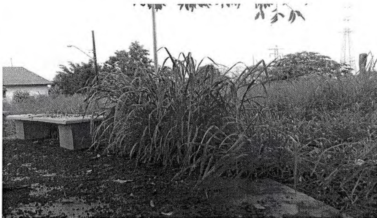
AREA VERDE DO JARDIM IMPERIAL AO LADO DA QUADRA POLIESPORTIVA COM MATO ALTO.