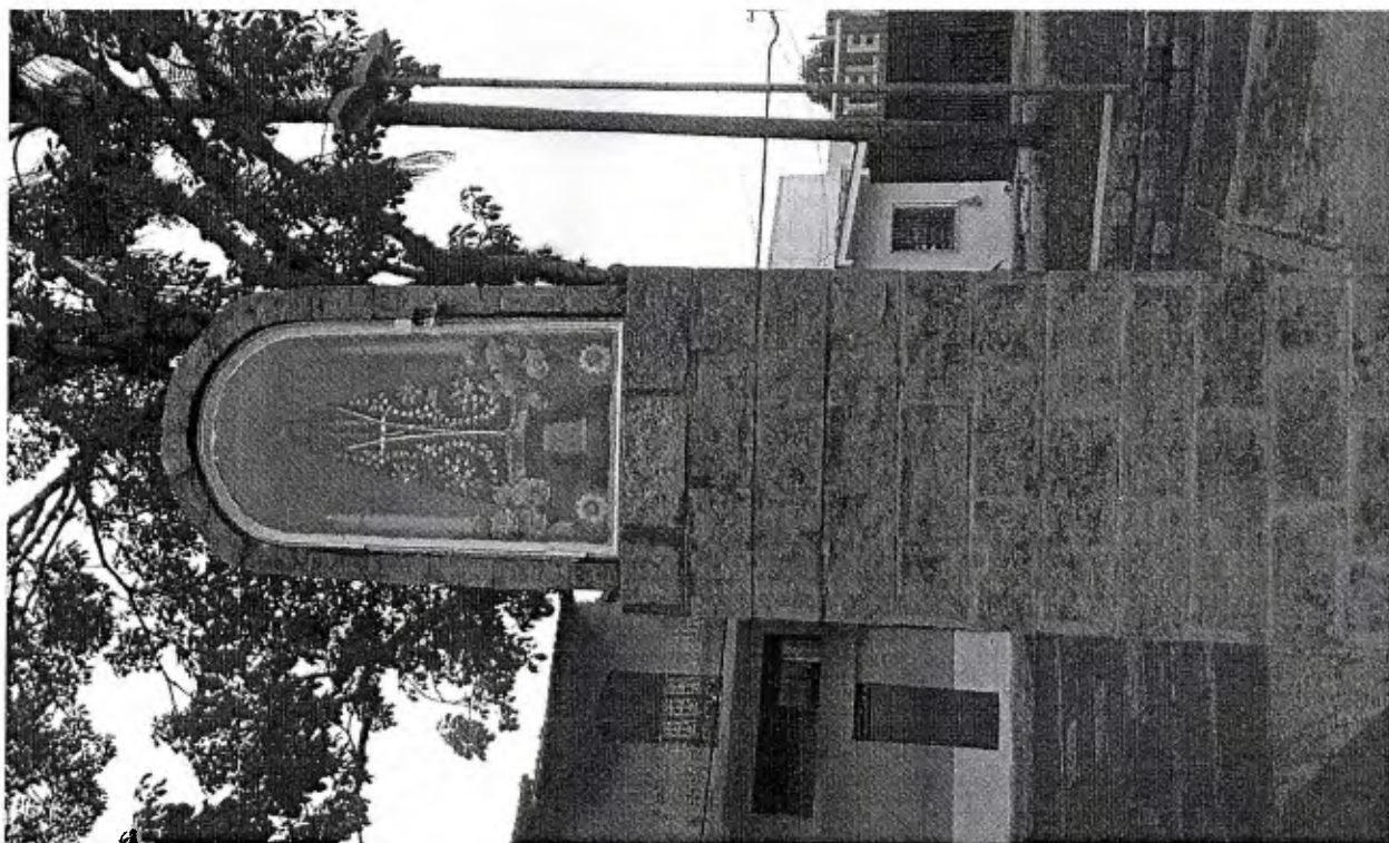
Imagem da Nossa Senhora, localizada na Praça do Patriota, bairro Bosque. Santa esta protegida com capela.