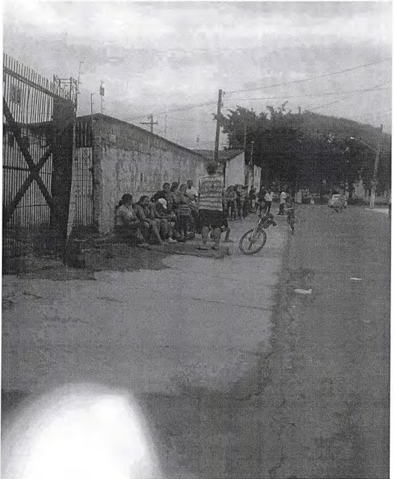
Pacientes aguardam abertura do posto de saúde no Araretama.