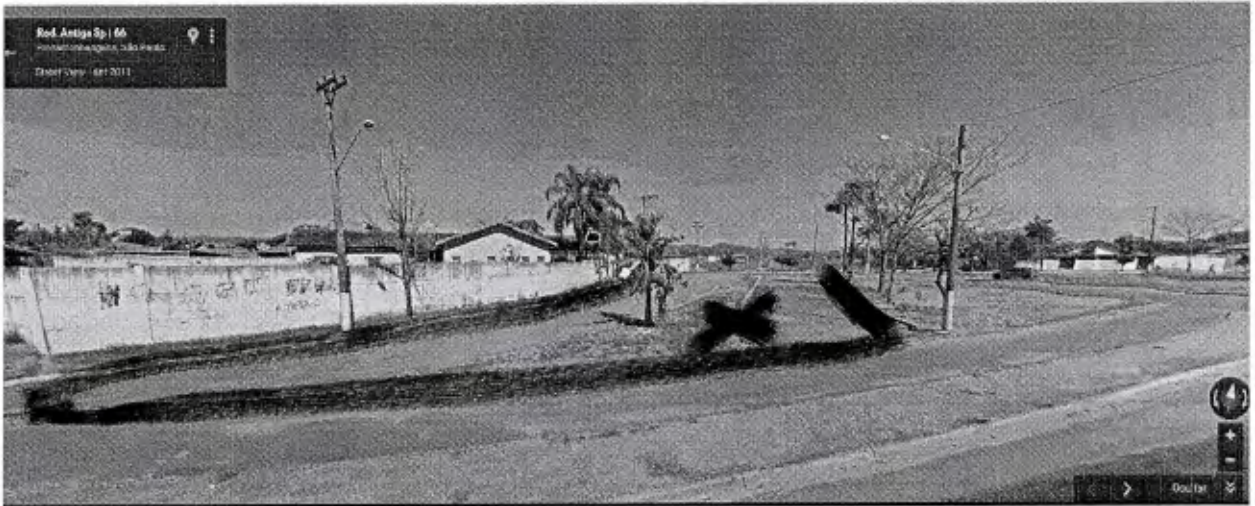
Vista da Creche (Id esquerdo) e ruas desativadas (direita) – Trera dos Ipês1

Local ao lado da Creche passou por mudanças onde ruas foram desativadas, sendo que a população solicita que seja instalada um Parquinho Infantil e uma AMI – Academia Melhor Idade