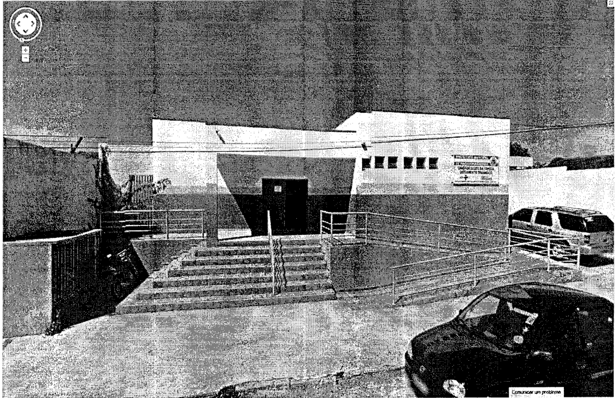
FACHADA DO PRÉDIO DA UNIDADE SAÚDE DA FAMÍLIA – TRIÂNGULO ATUALMENTE SEM GRADE DE PROTEÇÃO