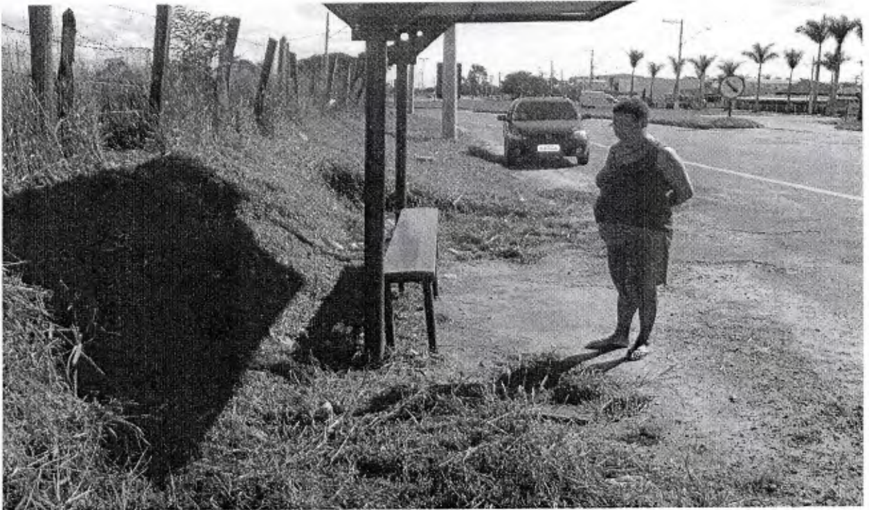
DETALHE: Abrigo de Passageiros sem calçamento.