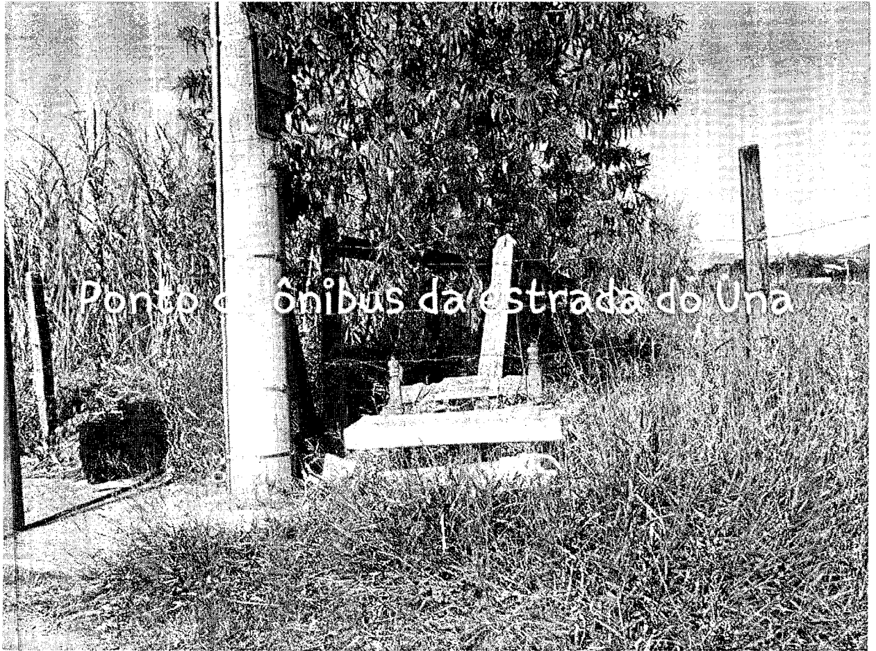
Estrada Sebastião Vieira Machado, Parque Lago Azul