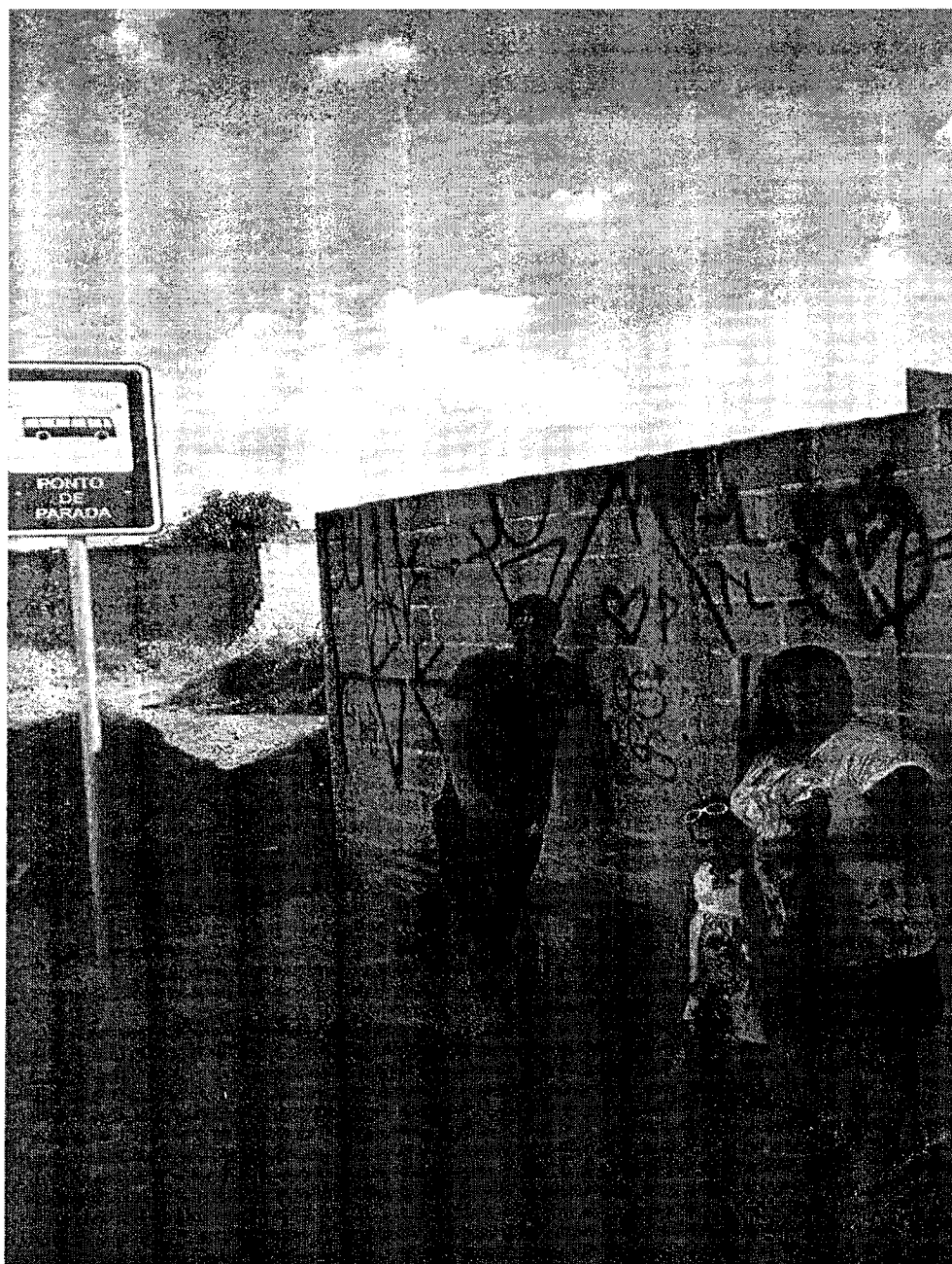
Rua Capitão João Monteiro Amaral – Mombaça

* Usuários do transporte público, aguardam ônibus no ponto de parada.