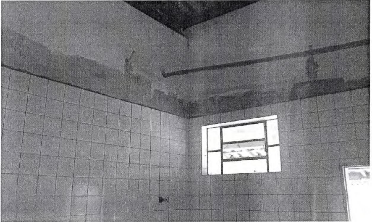
-Sala de espera pós cirurgia, encontra-se sem rejunte, sem iluminação, sem forro

ABRIGO MUNICIPAL – VISITA DIA 12 DE JUNHO DE 2015