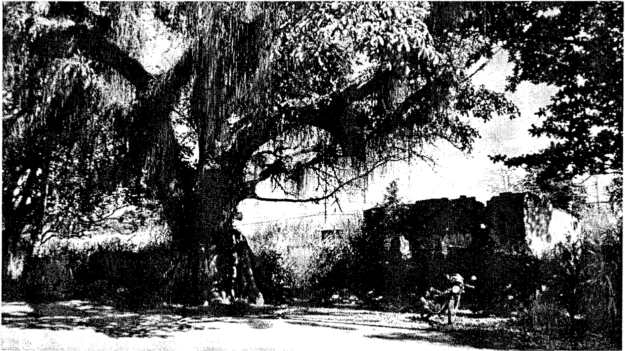
Figueira "Bi-centenária" - Patrimônio Histórico de Pindamonhangaba