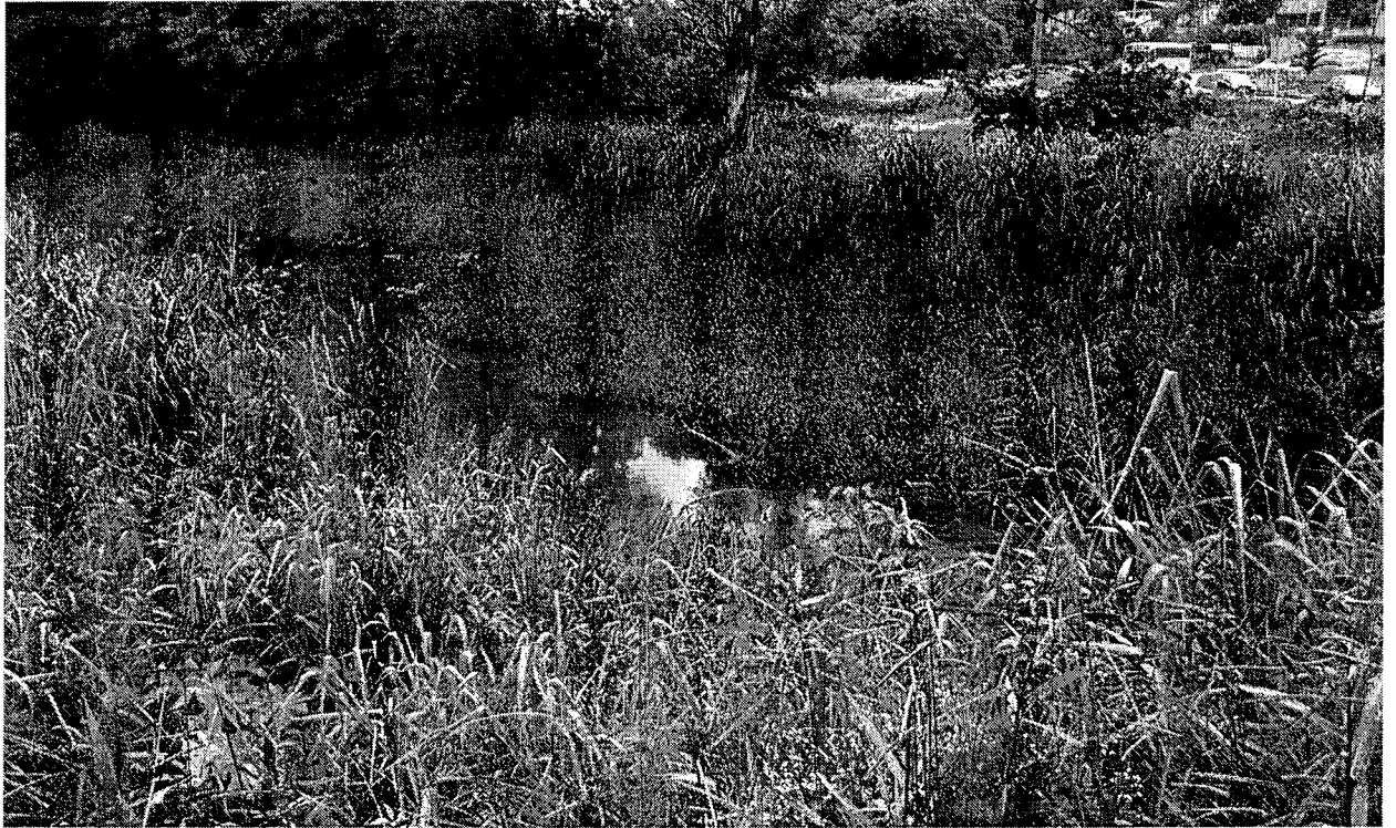
Ribeirão do Curtume – Bairro Residencial Andrade