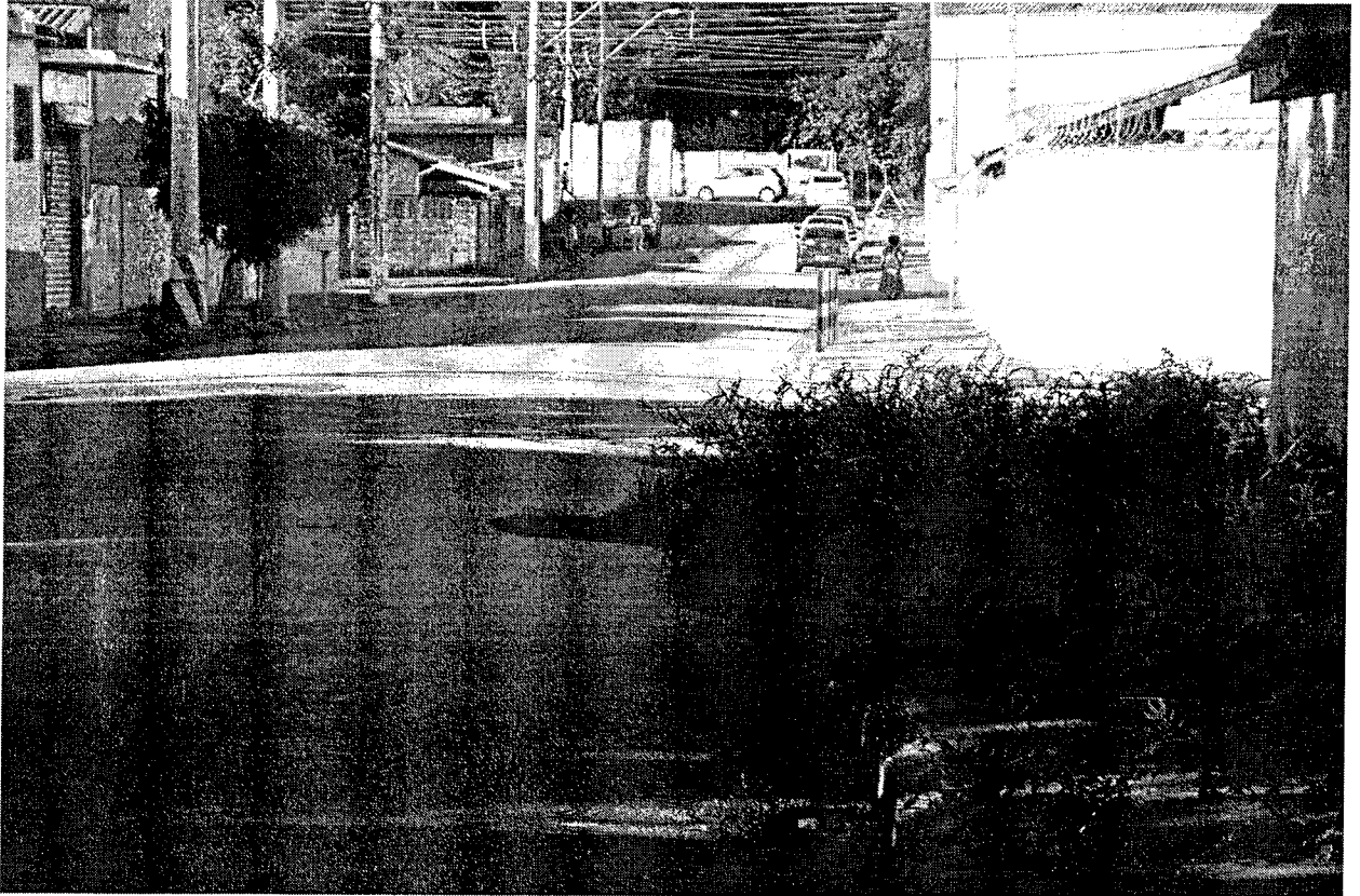
Calçada tomada por mato, obstruindo a passagem de pedestres