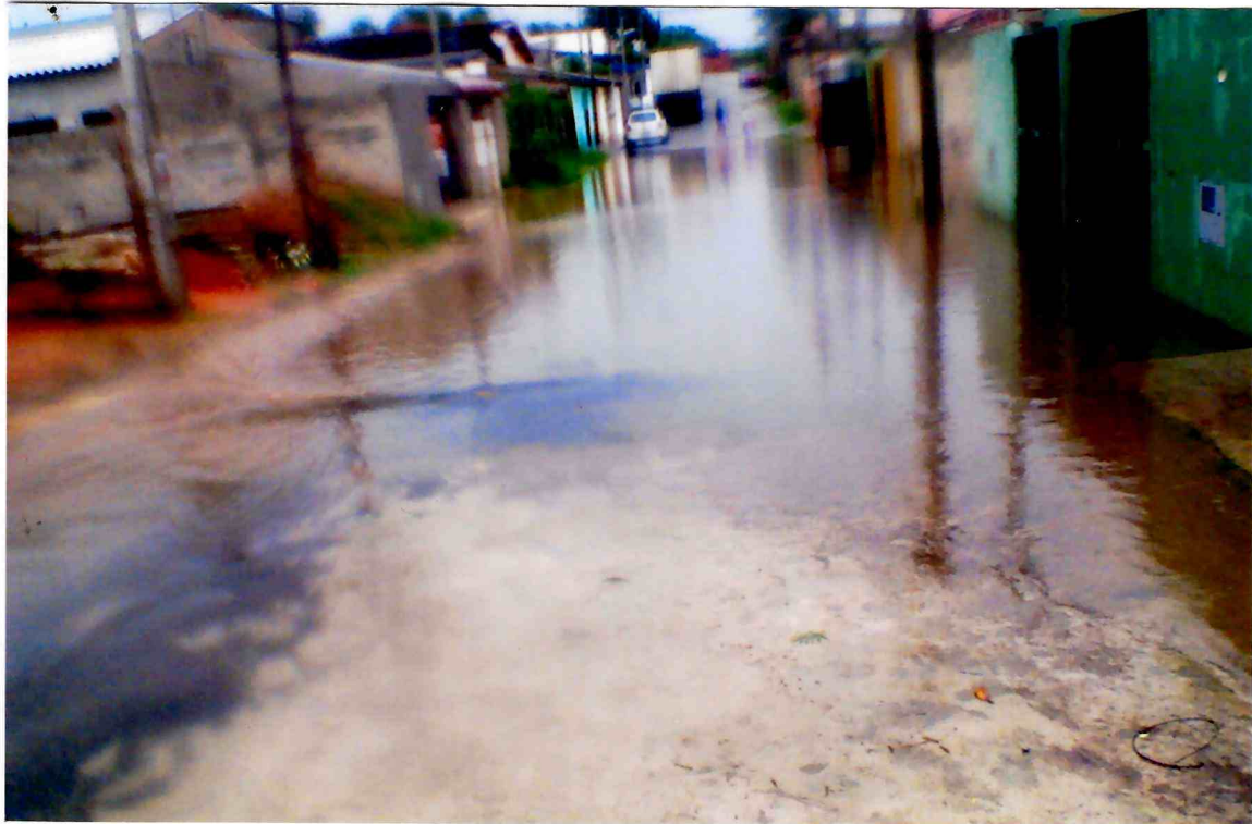
Imagens da Rua Moacir Gonçalves Araújo, altura do Número 40 – Loteamento Jardim Araretama