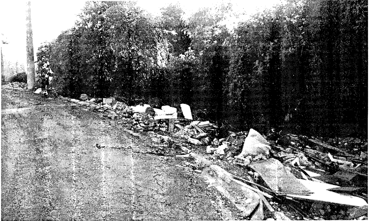
Rua Eduardo Prates da Fonseca, final da rua, atrás do Campo do São Paulo