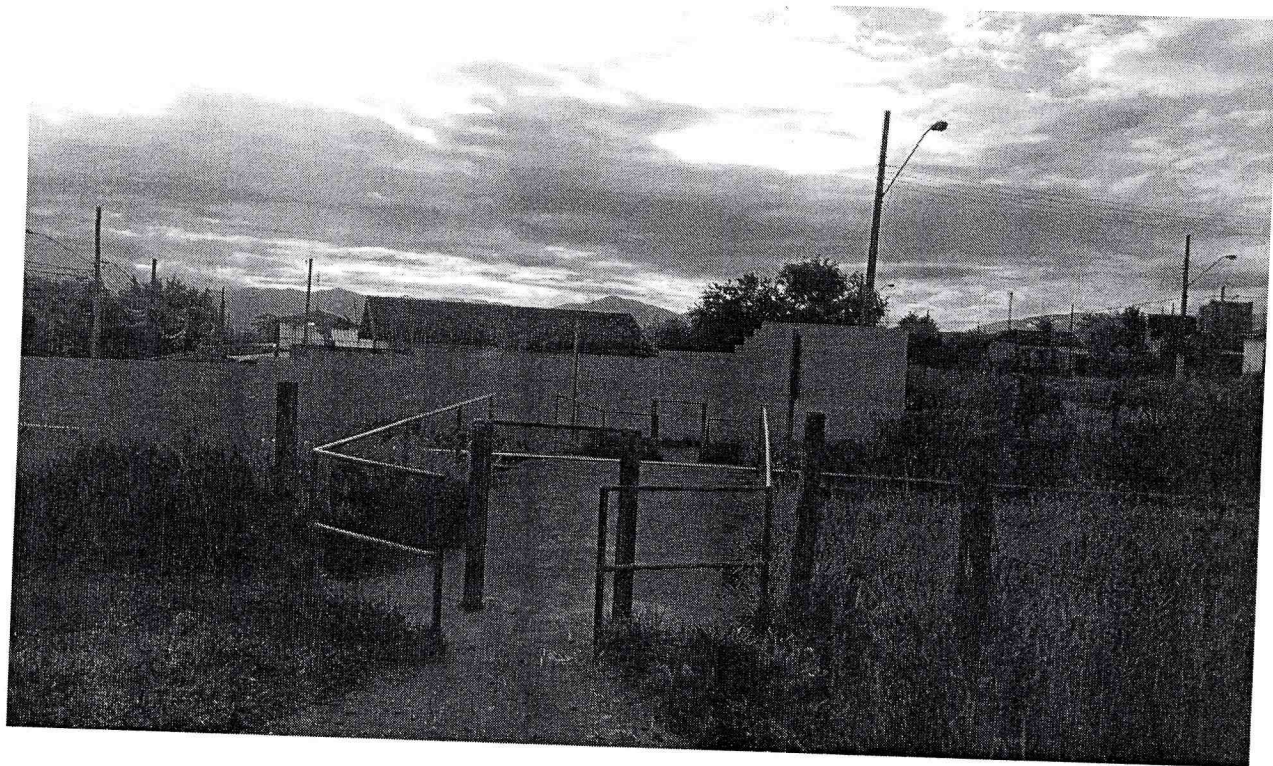
SP062 -Estrada que liga Pindamonhangaba x Taubaté. Pindamonhangaba/SP – Bairro Araretama

- Local sugerido pelos munícipes para construção da passarela sobre a linha férrea