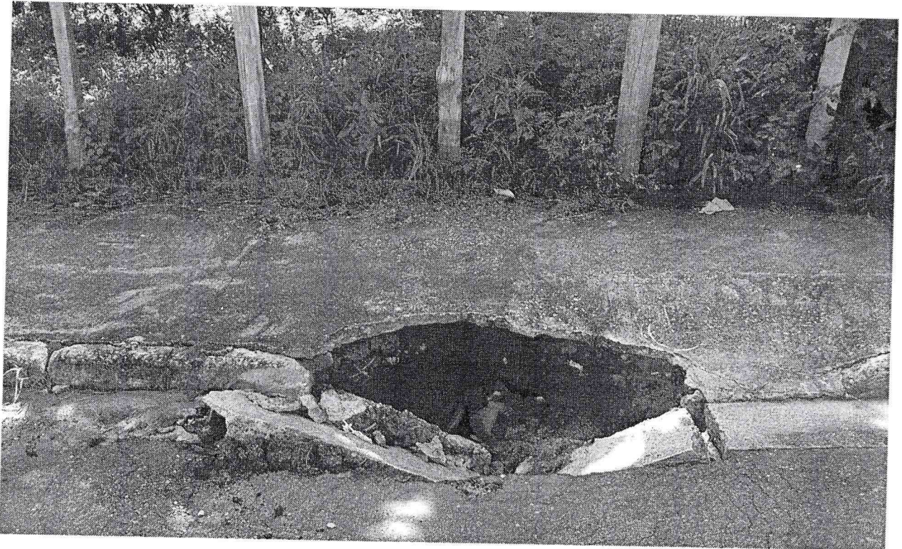
Calçada cedeu, formando cratera