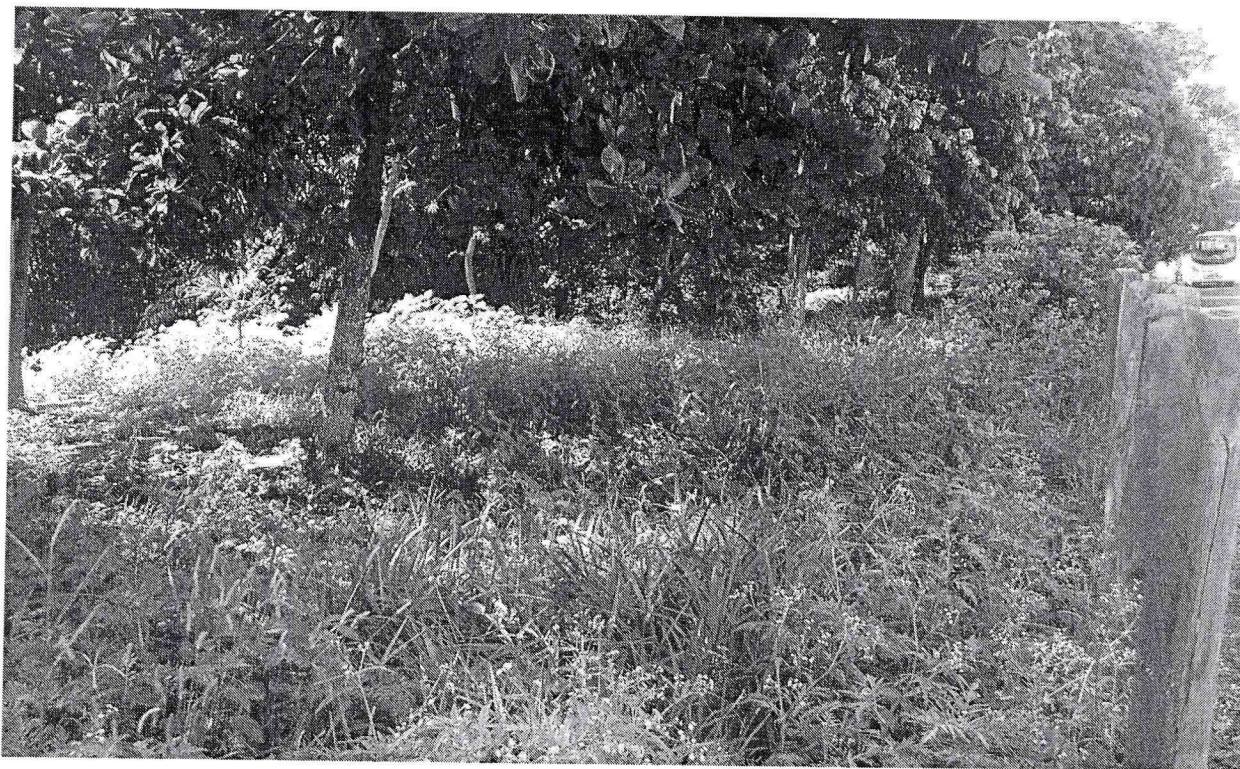
Área Verde do Crispim Rua Felisbino de Almeida