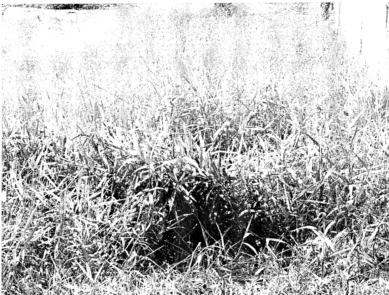
Terreno na rua Joaquim Belo do Amorim, Ouro Verde, defronte ao depósito de gás.