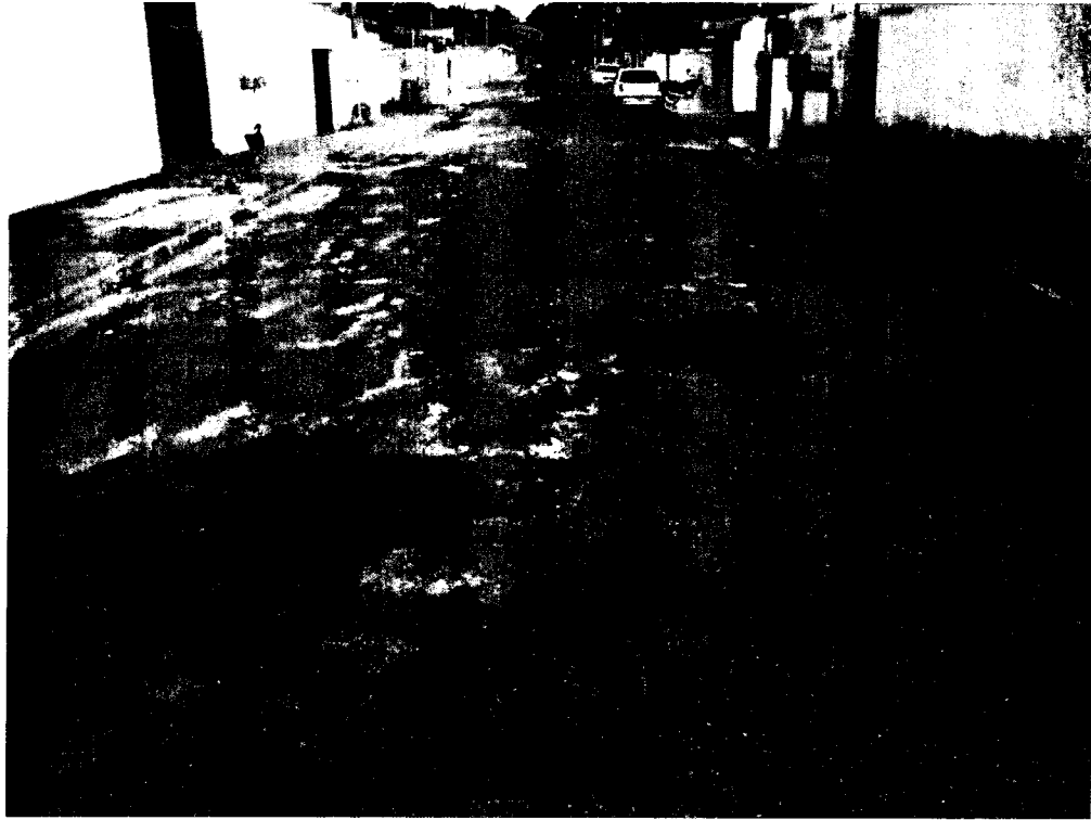
Rua Bezerra de Menezes