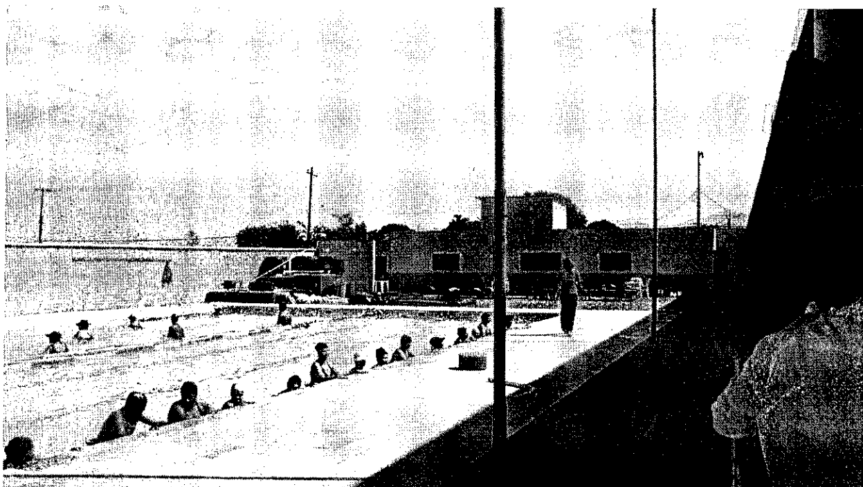
PISCINA DO CENTRO ESPORTIVO ARARETAMA – SEM COBERTURA