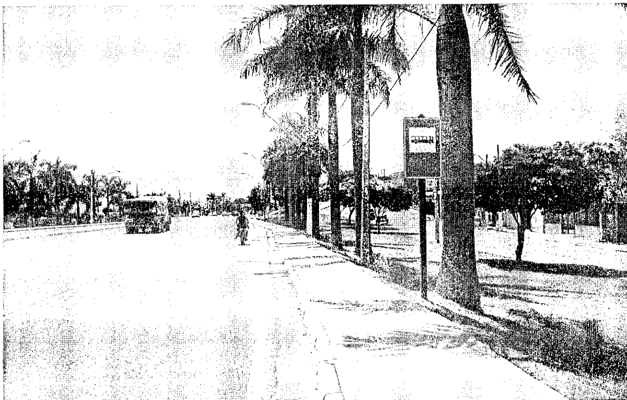
Parada de ônibus “Jardim Imperial” – sentido centro