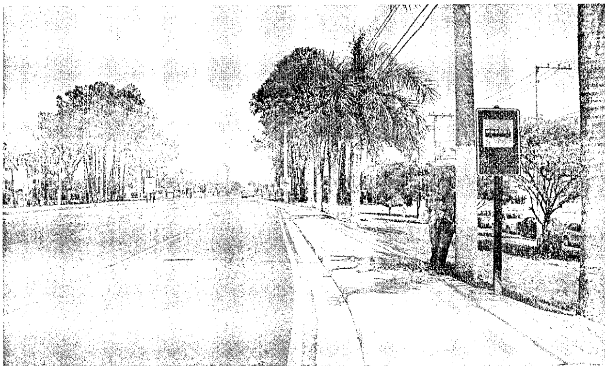
Parada de ônibus “Jardim Imperial” – sentido outra