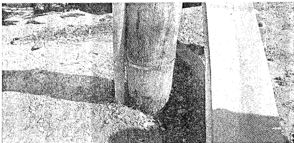
BASE DO POSTE PODRE - O MESMO PODE CAIR A QUALQUER MOMENTO