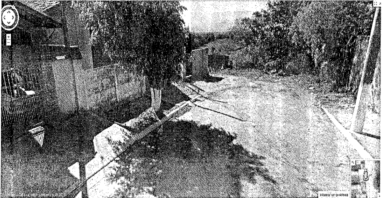
RUA JOAQUIM ANTUNES BASTOS – VILA SÃO BENEDITO – MOREIRA CÉSAR FINAL DA RUA NÃO É ASFALTADA