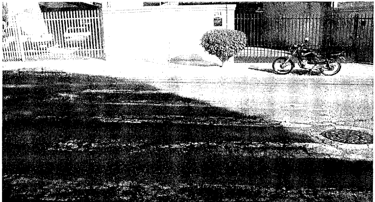
Faixa existente defronte ao nº 231 apagada e ao final da faixa c/ dois obstáculos (lixreira e árvore)