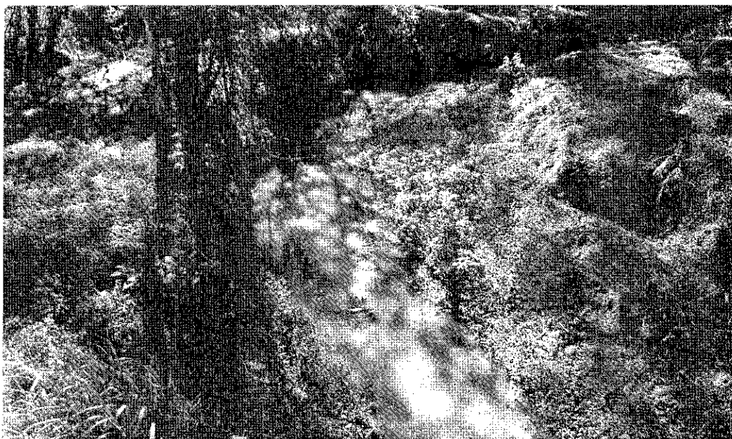
“Ribeirão da Galega” - área verde/ bairro do Mombaça – próximo ao túnel