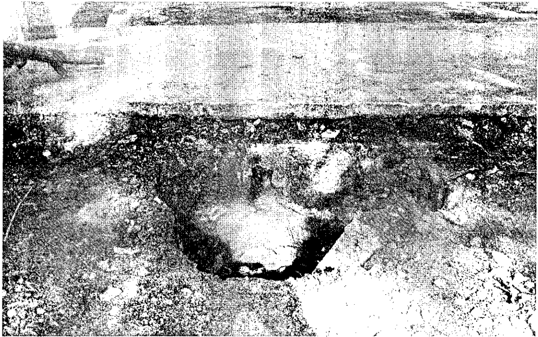
Buraco está se formando na área verde, passando por debaixo da calçada e asfalto