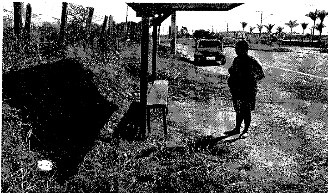
DETALHE: PONTO DE ÔNIBUS SEM CALÇADA