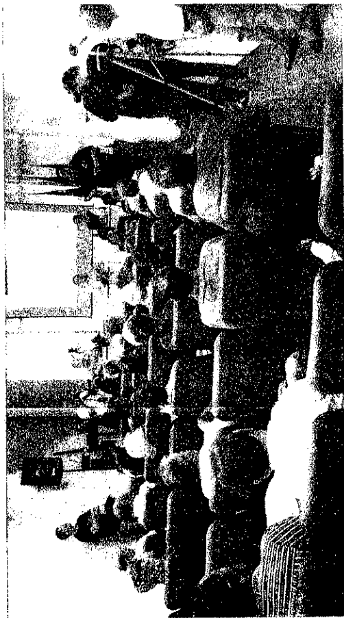
Merizys Vinício Cape

Depois de acatadas pela população participante na audiência, as propostas foram encaminhadas à Câmara Municipal para a devida aprovação.